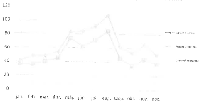
Ellátott esetek száma havi bontásban, életkor szerint

Amennyiben a forgalom alakulását életkor szerinti bontásban is vizsgáljuk, akkor az alábbi grafikonon jól látható, hogy a forgalom változásait alapvetően a felnőttek megjelenési gyakorisága határozta meg, míg a gyermekek megjelenési gyakorisága a nyári hónapokban növekedett meg.